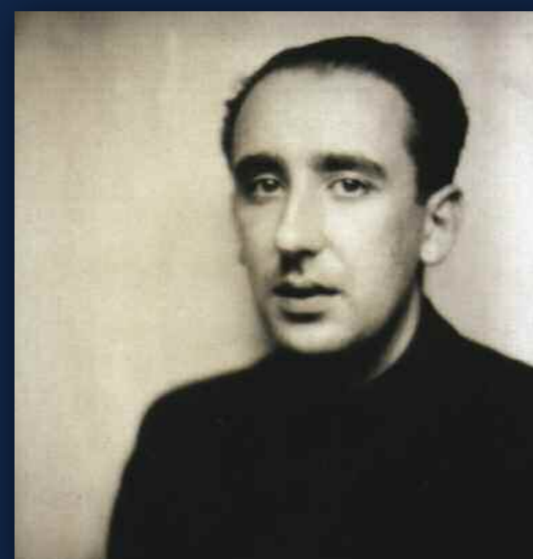
Cunqueiro ca. 1937