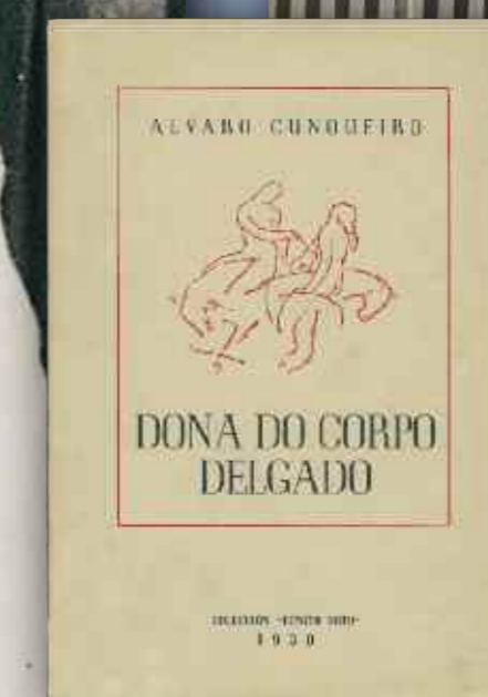
Tras un longo período sen escribir en galego, en 1950 ve a luz o poemario Dona do corpo delgado

Nestes anos autoedita pequenas xoias bibliográficas para distribuír entre os amigos