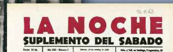
A finais dos anos corenta retoma as colaboracións na prensa galega