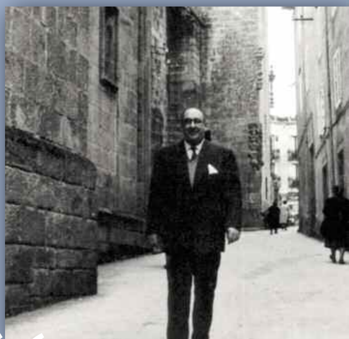
Primeira colaboración de Cunqueiro en Faro de Vigo

Nesta segunda etapa mindoniense, que se estende ata 1961, ano en que se traslada a Vigo para traballar como colaborador fixo en Faro de Vigo , publicará moitas das súas páxinas literarias en galego.